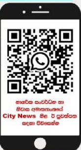
නාගරික සංවර්ධන හා නිවාස අමාත්‍යාංශයේ City News හි ඊ පුවත්පත සඳහා පිරිසිදුකිරීම