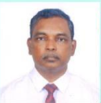
අ.වි.ජී.ජී. රණේසා සායන්ගේ වෙරළ කලාපය හා වෙරළ පළාත් කළමනාකරණ අධිකාරියේ අධ්‍යක්ෂවරයා

වෙරට වෙරළබඩ පරිසර තත්ත්වය වැඩි දියුණු කිරීම, වෙරළ තීරය සංවර්ධනය කිරීම හා කළමනාකරණය කිරීම, වෙරළබඩ යටිතල පහසුකම් ආරක්ෂණය කිරීම, වෙරළබඩ ප්‍රජාවගේ ජීවන තත්ත්වය උසුළු කිරීම, වෙරළබඩ සම්පත් මත පදනම්වූ ආර්ථික සංවර්ධනය පහසු කරවීම සහ ප්‍රවර්ධනය කිරීම අප ආයතනයේ අරමුණු වනවා.