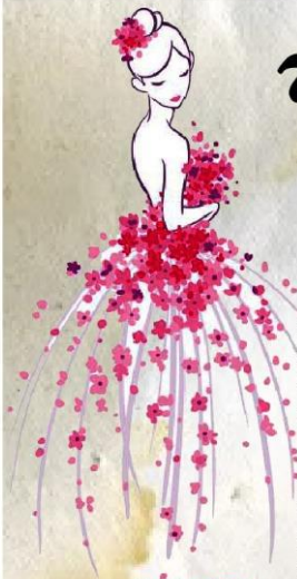
- ශිභාරා බණ්ඩාර -