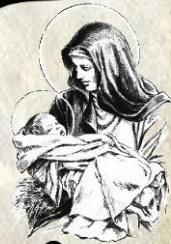
- තිරිණාමික -

නොලැබෙනා මල් කැකුළු රහසේ ගෙනෙවිත් රැන්දු සුළඟ හුඹ හරි ගපුරා මටම ඇයි මේ විශරා වෙන ගසක ඉති රූසිරා බඩලමින් නොක සැරසු සුළඟ ඇවිදින් විසිරා මලක් මා මත රැඳුණු සුවද මා මත බැඳුණු පහස සියොලන දැවුණු මගේ හිස මත පිපුණු මලකි හුඹ මගේ නොවුණු