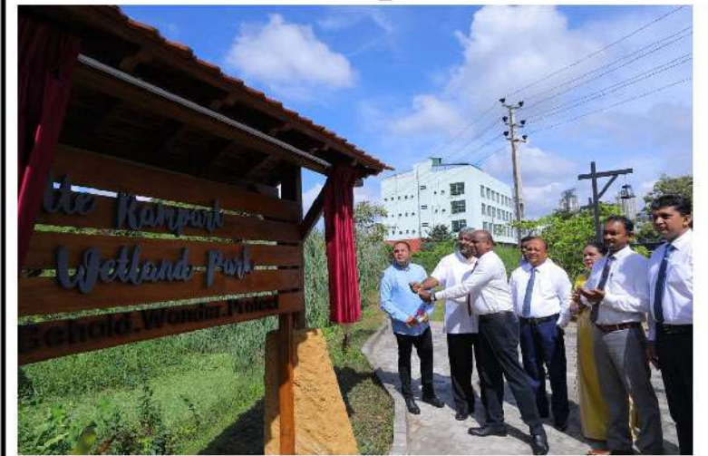
කුමන ආණ්ඩුවක් බලයට පත්වුවද ජනතාවට හිතකර ව්‍යාපෘති අඛණ්ඩව ඉදිරියට ක්‍රියාත්මක කළ යුතු බව නාගරික සංවර්ධන හා නිවාස අමාත්‍ය ප්‍රසන්න රණතුංග මහතා පසුගිය දා පැවසීය.

ලෝක නගර දින දා කෝට්ටේ කොටු බැම්ම හෙළ බිම් උද්‍යානය ජනතා අයිතියට