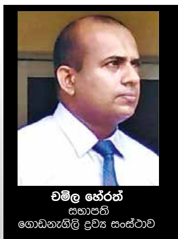
වමල භේරත් සභාපති ගොඩනැගිලි ද්‍රව්‍ය සංස්ථාව

ප්‍රශ්නය - කොළඹ තිබෙන වාණිජමය වටිනාකම වැඩි ඉඩම් එක එකකෙනා අල්ලාගෙන තිබෙනවා. ඒ සම්බන්ධයෙන් ඔබතුමාන්ලාට මැදිහත් වීමක් කරන්න පුළුවන්ද?