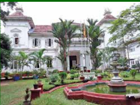
නව දිස්ත්‍රික් කාර්යාල ගොඩනැගිල්ල